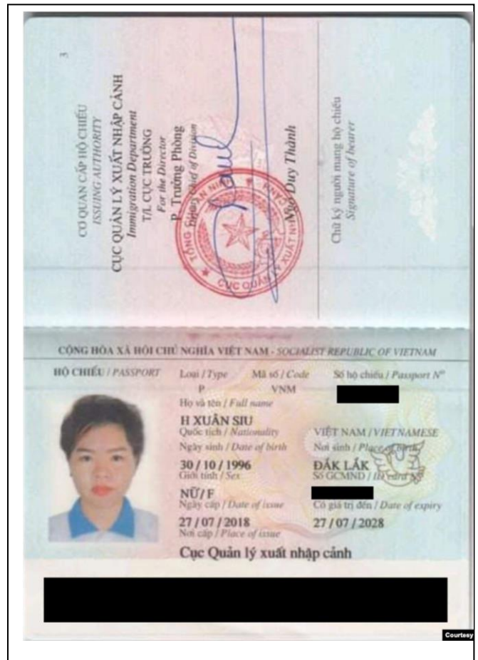
Hình ảnh chụp giấy khai sinh, sổ hộ khẩu và hộ chiếu cho thấy sự sai lệch năm sinh của H Xuân Siu.

Một người trả lời điện thoại từ văn phòng Công an Huyện Đắk Đoa ở tỉnh Gia Lai nói với VOA rằng cơ quan này không thể cấp thẻ căn cước công dân cho người không phải là cư dân của tỉnh. Ông nói ông không rõ liệu cơ quan của ông có hồ sơ của H Xuân Siu hay không.